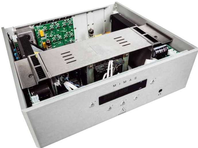
Der üppig dimensionierte Netztrafo sitzt unter einer stabilen Blechbrücke, die den Trafo einerseits fixiert und damit ruhig hält und ihn andererseits abschirmt und damit die Eingangsstufe vor Einstreuungen schützt

wohl auf der Front als auch auf der Fernbedienung mit wenig Bedienelementen auszukommen. Die Folge ist, dass man sich ohne die Bedienungsanleitung nur schwer zurechtfindet. Hätten Sie erraten, dass man die Lautstärke am Gerät dadurch regelt, dass man links oder rechts auf das Display drückt?