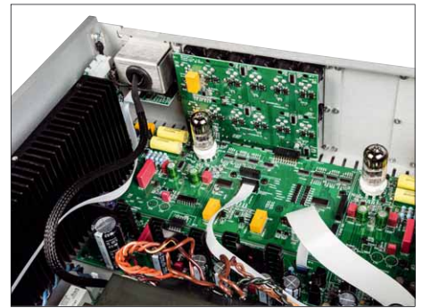
Die röhrenbestückte Eingangsstufe sitzt unmittelbar hinter den Eingangsbuchsen und gewährleistet so kurze Signalwege. Die Blenden in der Rückwand können herausgenommen werden, um den Anschlüssen des optionalen Phonomoduls und des DAC-Moduls Platz zu machen

hender Name gegeben werden. Darüber hinaus lässt sich die Eingangsempfindlichkeit jedes Eingangs justieren, sodass beim Umschalten zwischen den Eingängen alle Quellen gleich laut sind.